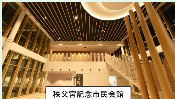
秩父宮記念市民会館

民間商業施設(不特定多数の人が出入りする準公共施設)等の木造、木質化に対する助成制度を創設してください。その際に「秩父産木材」の使用を促してください。